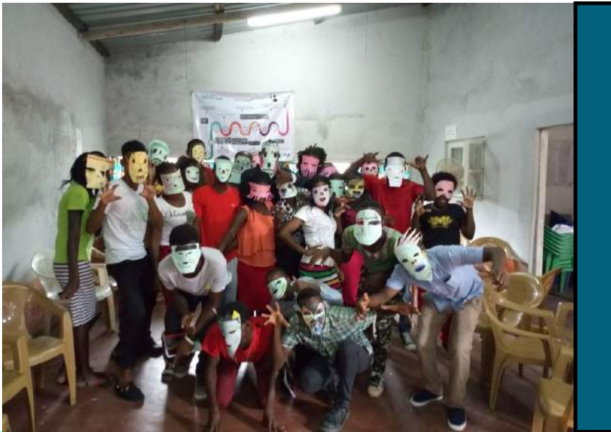
Sessão do MUVA no Bairro da Munhava Matopa