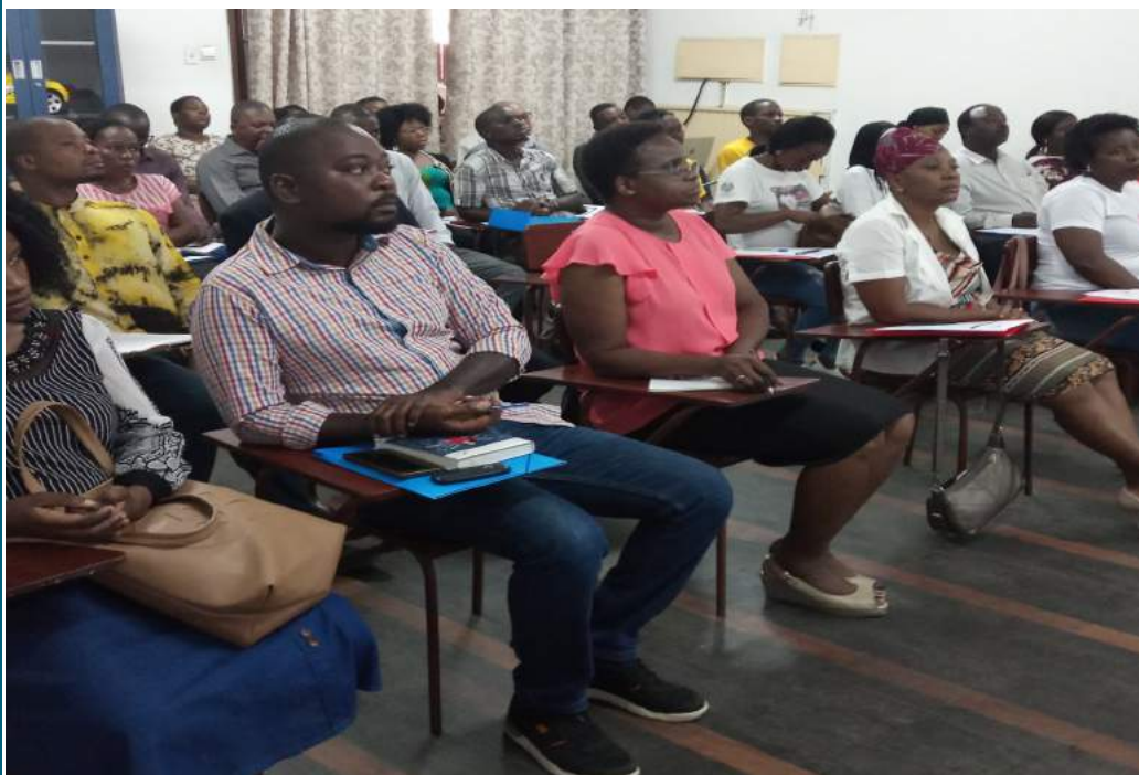
Empresas, Instituições de Educação Profissional e Direcção Provincial de Ciência, Tecnologia, Ensino Superior e Técnico-Profissional de Sofala

No encontro de Apresentação da Segunda fase do PROTTEP, abordou-se sobre a formação DUAL, onde o maior objectivo é de garantir a redução da deslocação de quadros através de uma cooperação produtiva entre as IEP's e Empresas, onde a empresa é uma parte activa do processo desde o momento de selecção até o fim da formação, nesta perspectiva, o estágio é parte integrante do processo de modo a garantir que o formando tenha conhecimentos teóricos na IEP e práticos na Empresa.