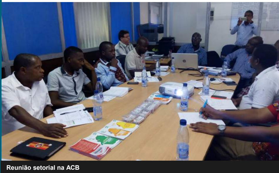
Reunião setorial na ACB