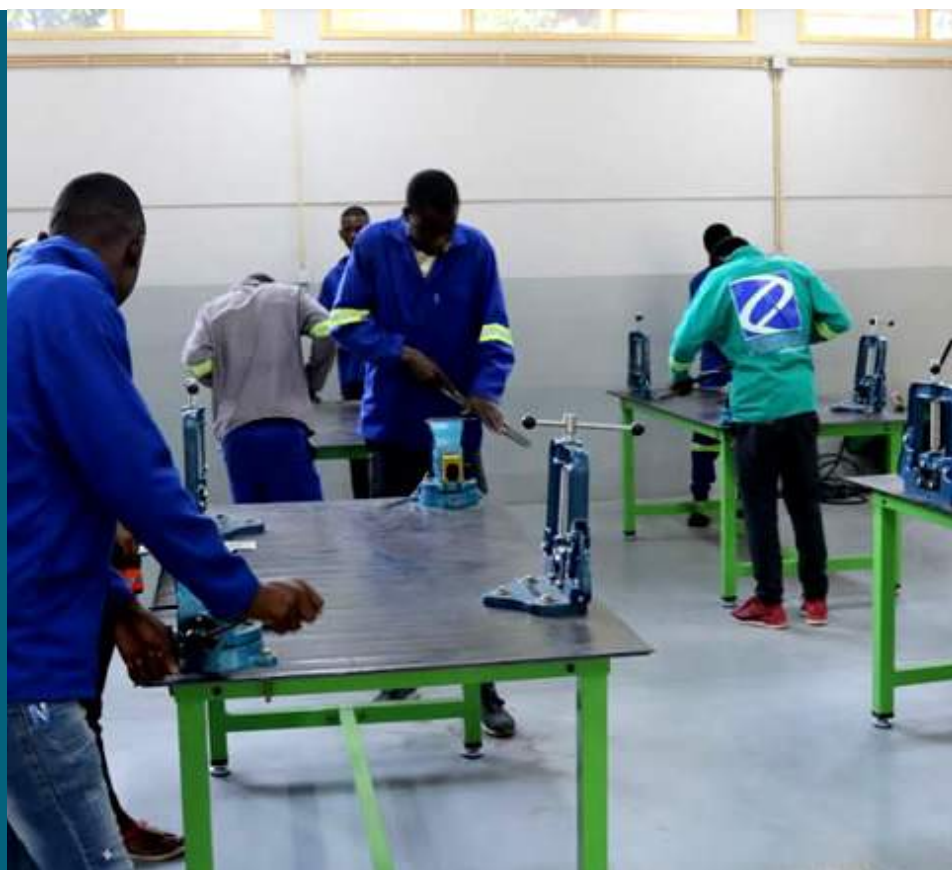
Legenda da foto

“A educação técnico-profissional é uma questão de bandeira na nossa governação e nós estamos a fazer esforços para que o que foi prometido seja uma realidade.